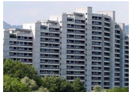
Fernwärmelieferung an Überbauung Telli