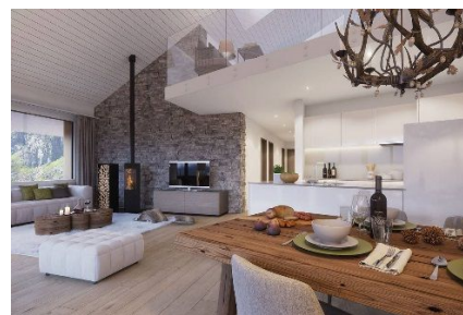
Dachwohnung Haus Wolf

Die Gebäude sind nach Minergie Standard gebaut.